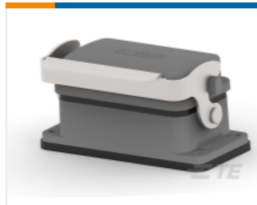
TE 产品编号T2120100220-000 ZGGP-H10BSK 1-7/2-8/3-9/4-6/5-10