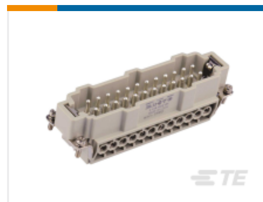
TE 产品编号 T2040242101-000 HE-024-M