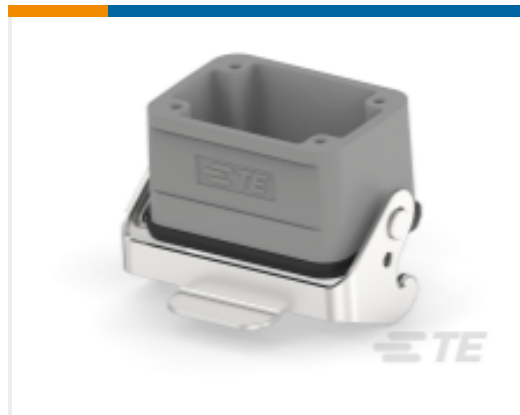
TE 产品编号T1730060000-000 H6B-TBF-T