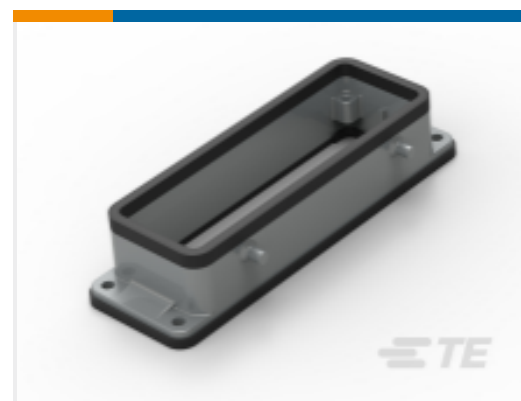
TE 产品编号 T1420240000-000 H24B-AG-BO