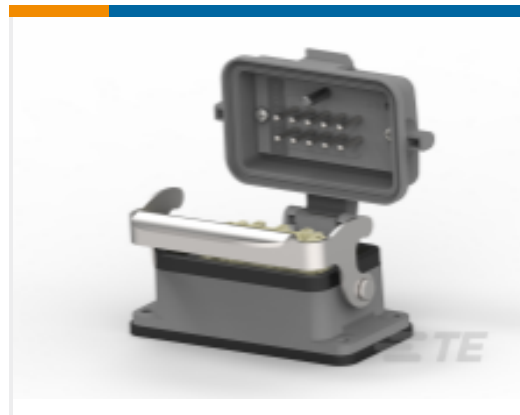
TE 产品编号T2120100219-000 ZGG-10DSTK,1-7,2-8,3-9,4-6,5-10