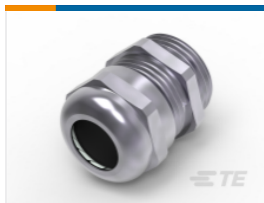
TE 产品编号 T3609250102-000 DLX-25-M