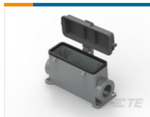
TE 产品编号 T1490240125-000 H24B-SDRH-BO-M25