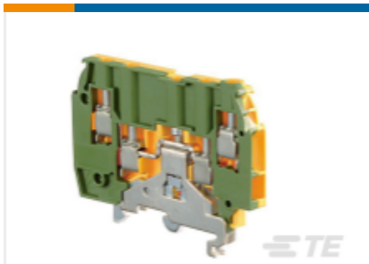
TE 产品编号1SNA195638R2300 M4/6.4A.P