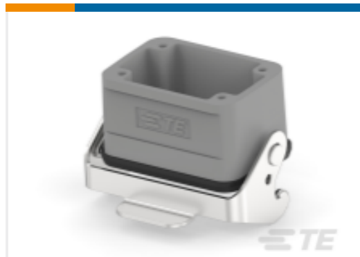
TE 产品编号T1730060000-000 H6B-TBF-T