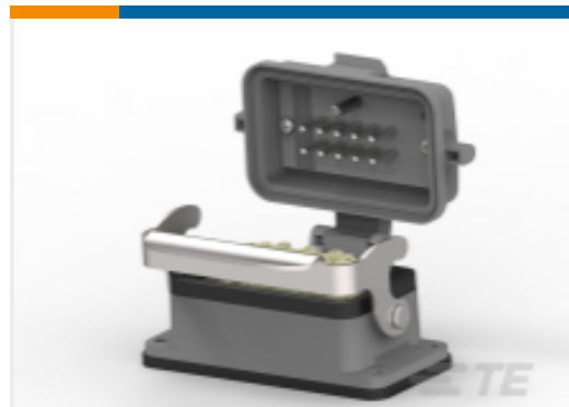
TE 产品编号T2120100219-000 ZGG-10DSTK,1-7,2-8,3-9,4-6,5-10