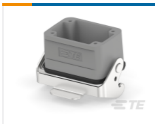
TE 产品编号T1730060000-000 H6B-TBF-T