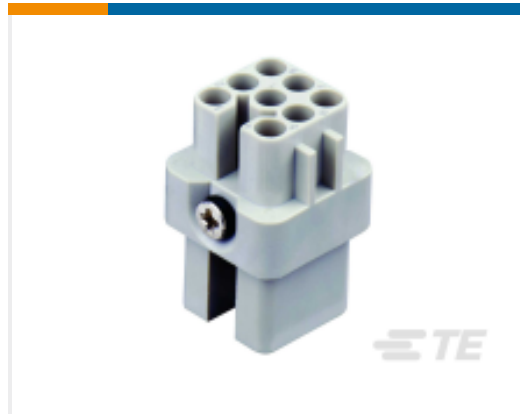
TE 产品编号T2020082201-000 HD-008-F