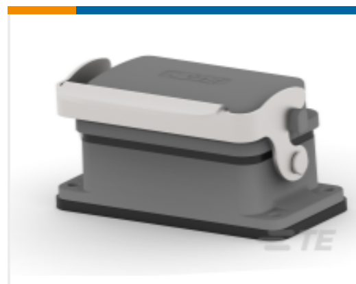
TE 产品编号T2120100220-000 ZGGP-H10BSK 1-7/2-8/3-9/4-6/5-10