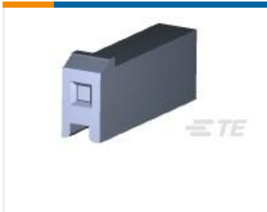
TE 产品编号640250-1 01P SL156 HSG W/LCK RAMP NATL