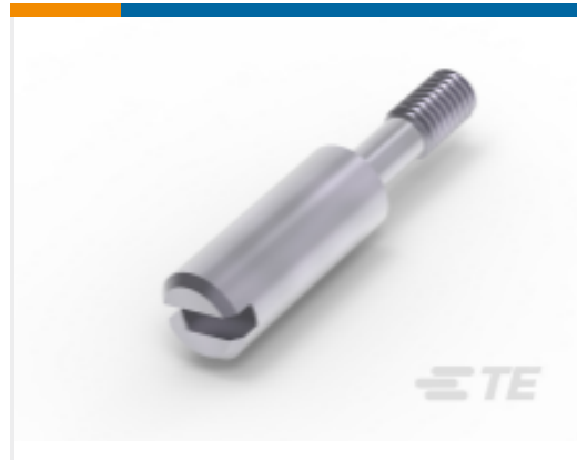
TE 产品编号T0931003003-000 CODING-PIN-M3