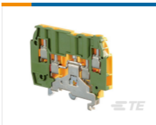
TE 产品编号1SNA195638R2300 M4/6.4A.P