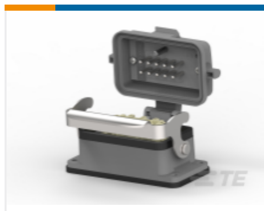
TE 产品编号T2120100219-000 ZGG-10DSTK,1-7,2-8,3-9,4-6,5-10