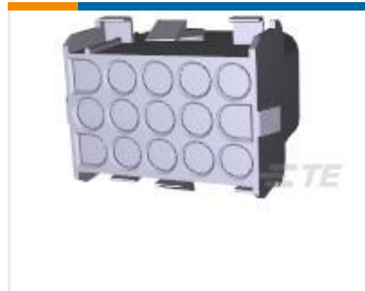
TE 产品编号1-480711-9 15P UMNL CAP HSG BLK