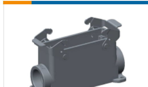
TE 产品编号T1470242232-000 H24B-SGRH-2M32