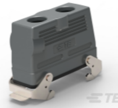
TE 产品编号 T1750242221-000 H24B-TBFH-2PG21