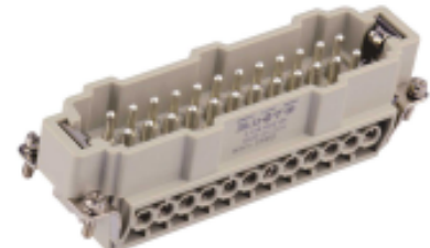
TE 产品编号 T2040242101-000 HE-024-M