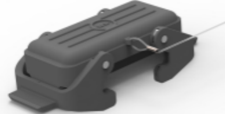
TE 产品编号 T1010241200-000 H24B-KDTP