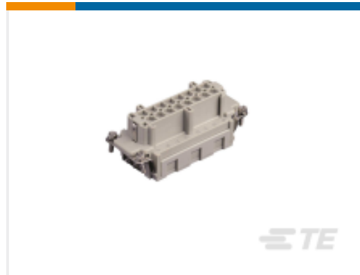
TE 产品编号T2040163201-000 HE-016-FS