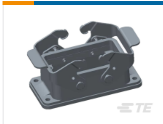
TE 产品编号T1410102000-000 H10B-AG