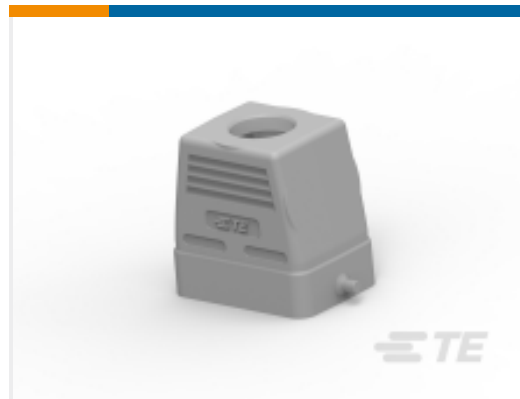
TE 产品编号T1320060121-000 H6B-TG-PG21