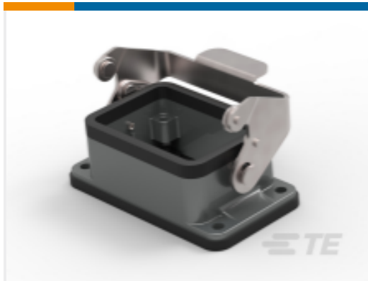
TE 产品编号T1500062000-000 H6B-AGS