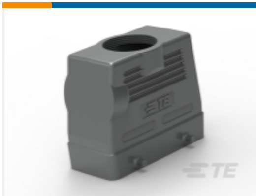
TE 产品编号T1240160121-000 H16B-TGH-PG21