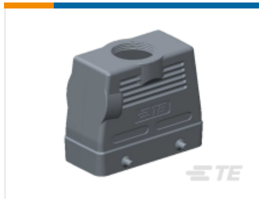
TE 产品编号T1240160132-000 H16B-TGH-M32