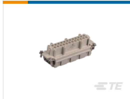
TE 产品编号T2040243201-000 HE-024-FS