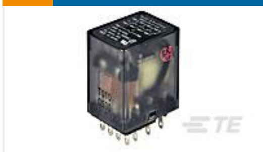
TE 产品编号5-1393122-8 KHAU-17D12-48=KH