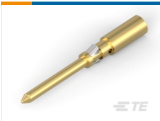
TE 产品编号T2020011025-000 DDM-2.5