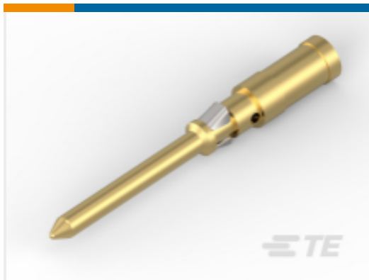
TE 产品编号T2020011015-000 DDM-1.5