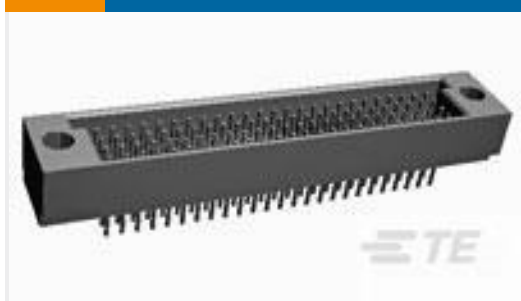
TE 产品编号5532436-5 ASSY,PIN,VERTICAL,HDI,LEAD-FRE