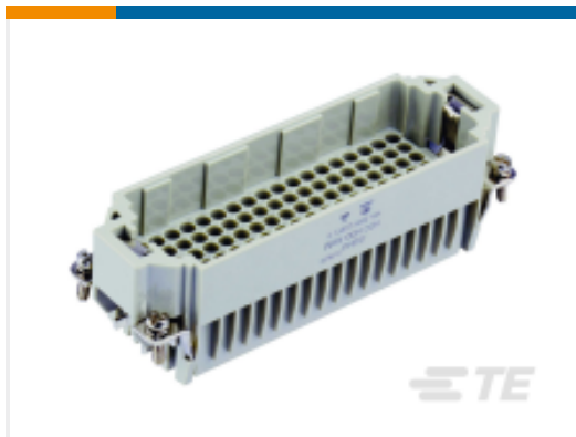
TE 产品编号T2032162101-000 HDD-108-M 109-216