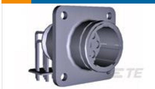
TE 产品编号1776903-1 CPC POSTED RCPT,13-7,R/A