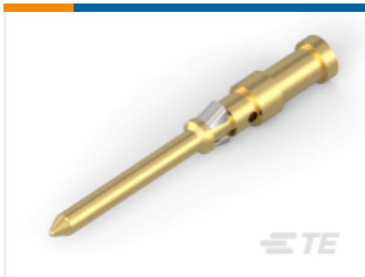
TE 产品编号T2020011002-000 DDM-0.3