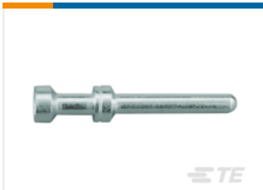
TE 产品编号T2030001015-000 CEM-1.5