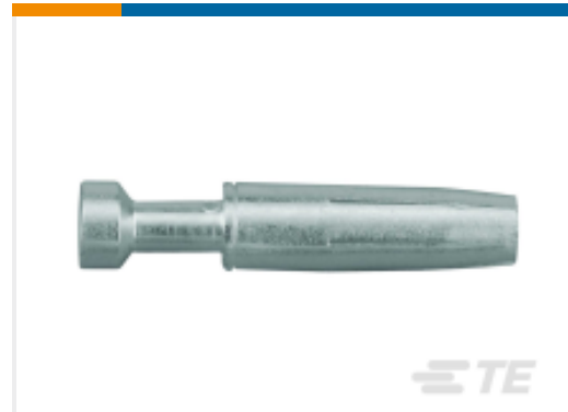
TE 产品编号T2030002010-000 CEF-1.0