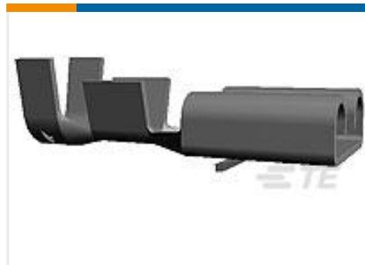
TE 产品编号5-160446-5 FF 250 REC 1.0-2.5MM2 TBBR