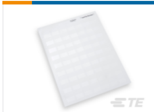
TE 产品编号9-1768016-7 CSL Self Laminating Polyester Labels