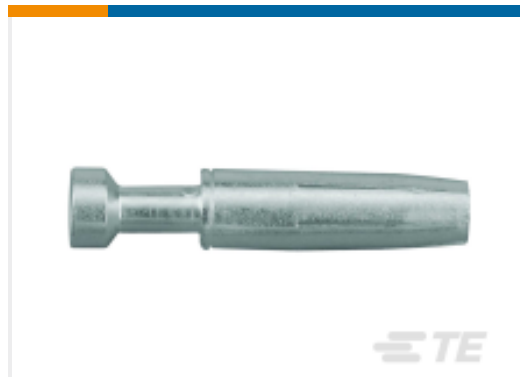
TE 产品编号T2030002015-000 CEF-1.5