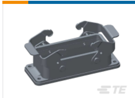
TE 产品编号T1410162000-000 H16B-AG