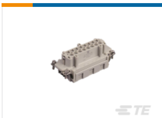
TE 产品编号T2040164201-000 HE-016-FC