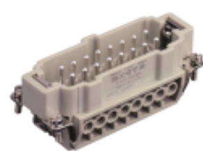
TE 产品编号 T2040162101-000 HE-016-M