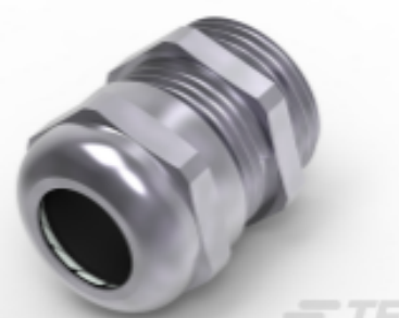
TE 产品编号 T3609210101-000 DLX-21-MS