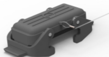
TE 产品编号 T1010161200-000 H16B-KDTP