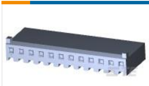
TE 产品编号1-770849-2 12P SL156 HSG W/LCK RMP & TABS