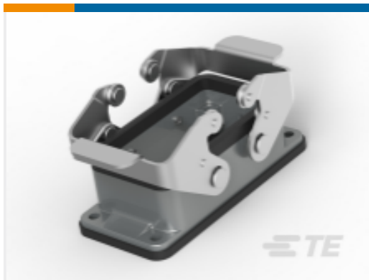
TE 产品编号T1410101000-000 H10B-AGS