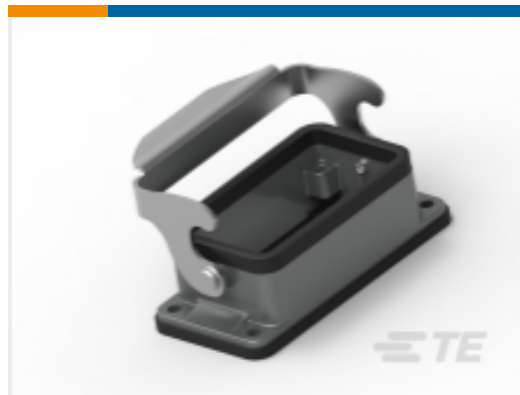
TE 产品编号T1500102000-000 H10B-AGS-LB