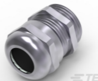
TE 产品编号 T3609160101-000 DLX-16-MS