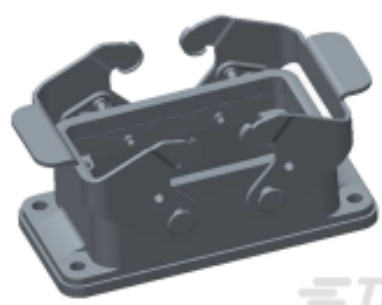
TE 产品编号 T1410102000-000 H10B-AG