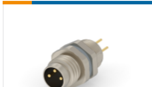
TE 产品编号T4042014031-000 M8.MLE.PNLFRONT.3POS.STR PCB