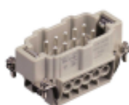
TE 产品编号 T2040102101-000 HE-010-M