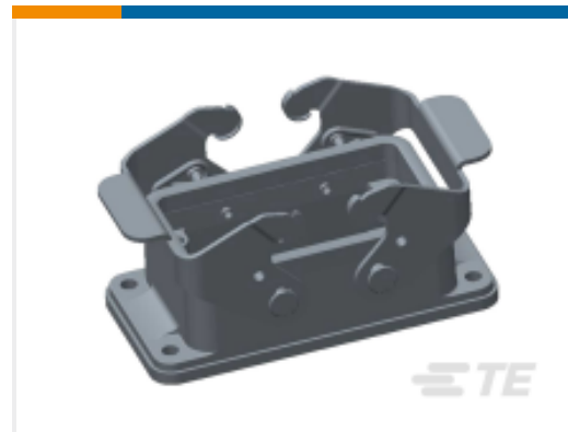
TE 产品编号T1410102000-100 H10B-AG