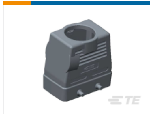
TE 产品编号T1240100132-000 H10B-TGH-M32