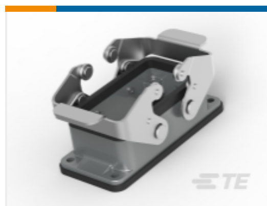
TE 产品编号 T1410101000-000 H10B-AGS