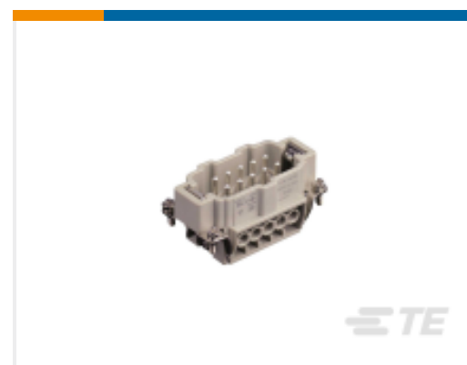
TE 产品编号 T2040102101-000 HE-010-M