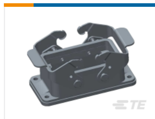
TE 产品编号 T1410102000-000 H10B-AG