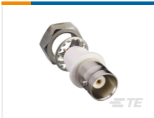
TE 产品编号CONBNC004 BNC Jack 50 Ohm Panel Mount