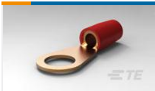
TE 产品编号324045 TERMINAL,T-N R 8 3/8