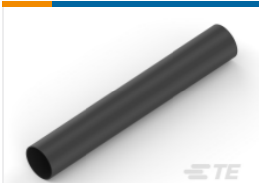
TE 产品编号NB11802001 ATUM-8/2-0-STK