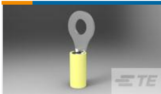
TE 产品编号35110 TERM, RT, PIDG,12-10, 1/4