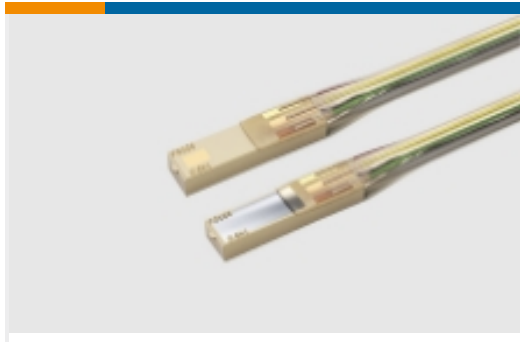
侵入式压力传感器(12)