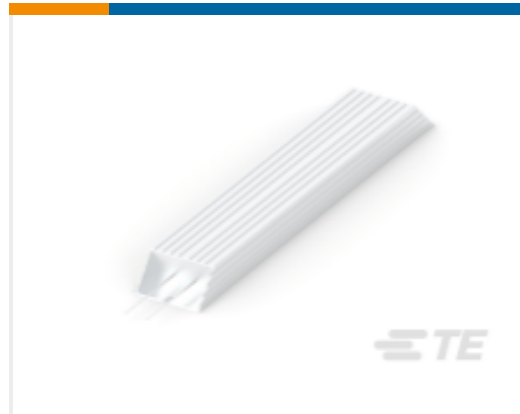
TE 产品编号3-2176512-3 CJP 800W 1K0 5% Lead