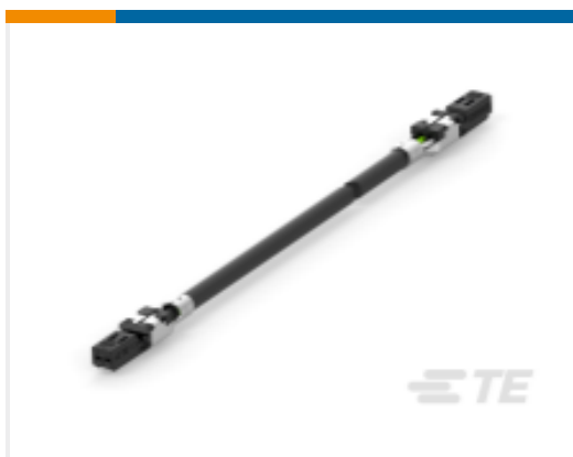
TE 产品编号2362764-1 MATENET,CABLE ASSY,1 GBPS UTP