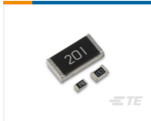
TE 产品编号5-2176328-5 CRGP 1206 330K 1%