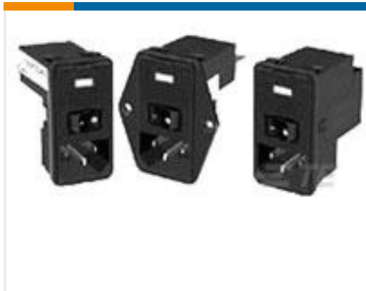
TE 产品编号4-6609107-4 PS0SSSXA=C1098