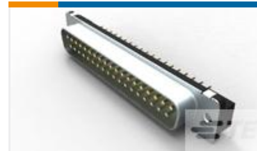
TE 产品编号5747375-8 37 PLUG SP/FMS INSRT