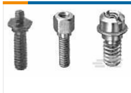
TE 产品编号786585-2 50SR SCREWLOCK KIT, FEMALE