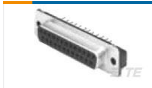
TE 产品编号5747150-8 09 RCPT SP/FMS INSRT