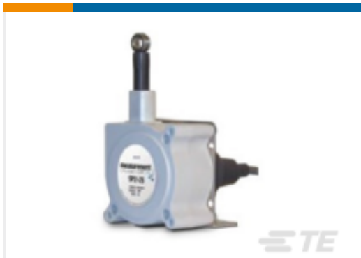
TE 产品编号SP2-50 STRING POT 50 INCH RANGE