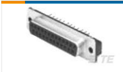
TE 产品编号5747301-8 37 RCPT SP/FMS INSRT