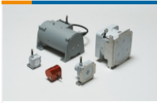
电缆致动位置传感器(13)