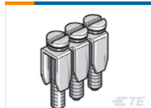
TE 产品编号1SNA173520R2200 BJM6D-10