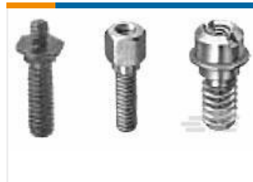
TE 产品编号749087-1 50SR SCREWLOCK KIT, FEMALE