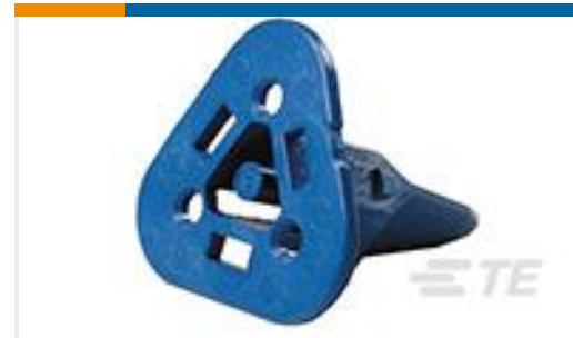
TE 产品编号W3S-1939 WEDGE LOCK, 3P, PLG, BLU, STD, J1939, DT