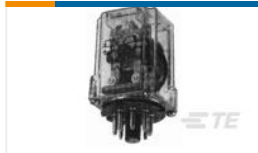
TE 产品编号9-1393101-0 KRP-11DG-6=KA/KB/KC/KR