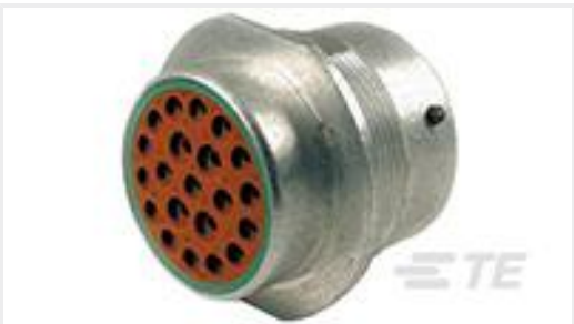
TE 产品编号HD34-24-21PN REC, 21P, AL, N, 12/16, P