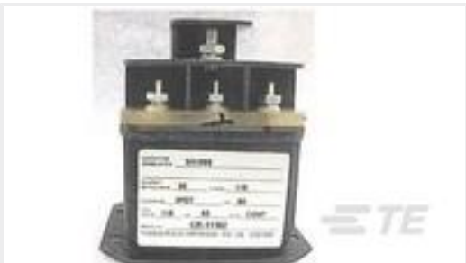
TE 产品编号1616042-1 SA106E=CONTACTOR, 3PDT-SS, 30A