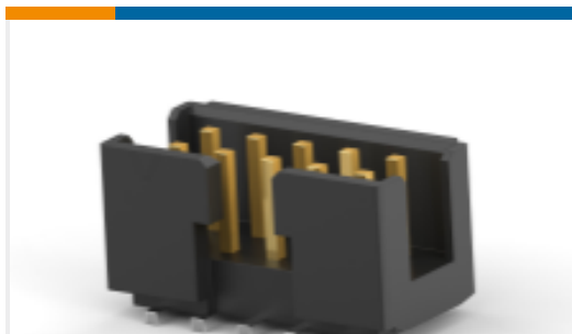
TE 产品编号1-2373376-0 10P,2MM,SHRD HDR,DRVVT,SMD,0.1 AU,TB