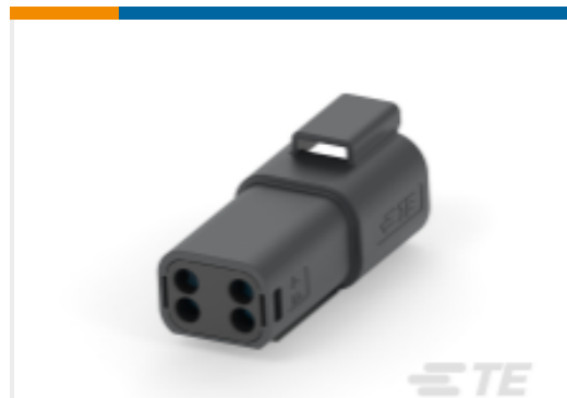
TE 产品编号 1-2600030-0 4CCT BLACK RECEP W/LARGE SEAL