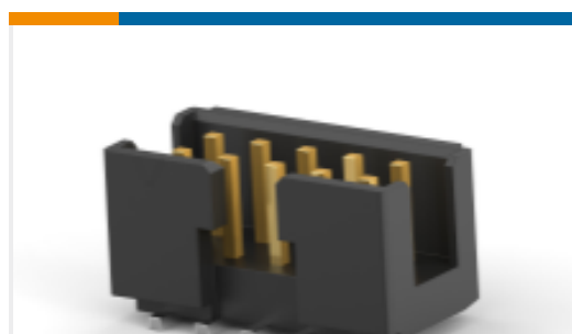
TE 产品编号 1-2373376-0 10P,2MM,SHRD HDR,DRV,T,SMD,0.1 AU,TB