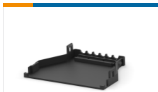
TE 产品编号 1776695-1 Strain Relief, D5200, Dynamic