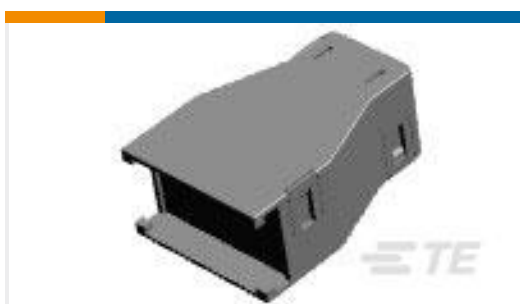
TE 产品编号 1986185-1 Strain Relief,6 Posn,D5200 Dynamic, 2