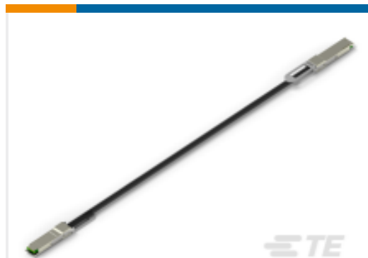
TE 产品编号 2333393-7 QSFP 25GIG 30AWG 3 METER