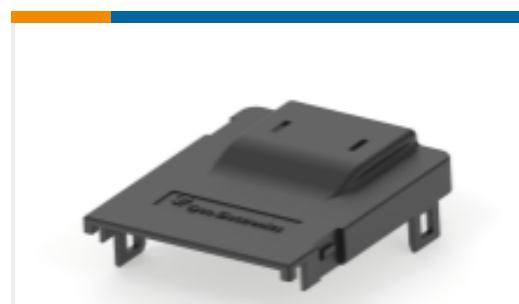
TE 产品编号 1986186-1 Strain Relief,20 Posn,D3000 Dynamic, 2