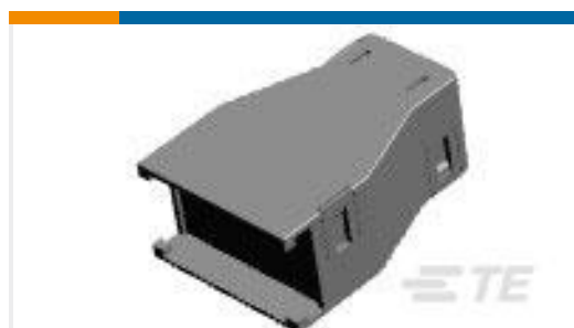
TE 产品编号1986185-1 Strain Relief,6 Posn,D5200 Dynamic. 2