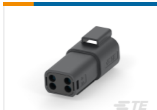
TE 产品编号1-2600030-0 4CCT BLACK RECEP W/LARGE SEAL