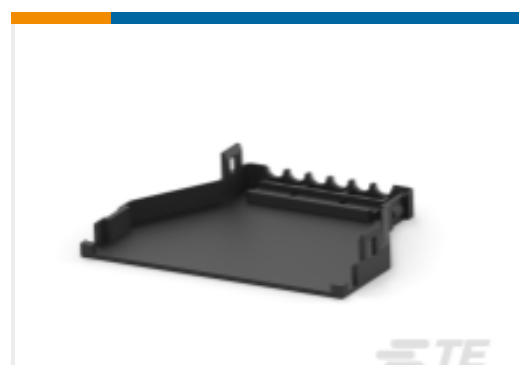
TE 产品编号1776695-1 Strain Relief, D5200, Dynamic