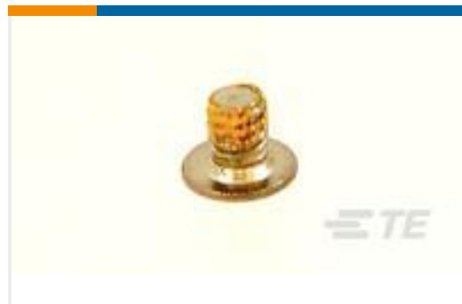
TE 产品编号1410946-1 MULTI-GIG SOC. CAP SCREW, CUSTOMIZED HDW