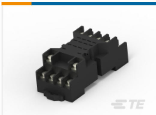
TE 产品编号2-1419106-6 27E894=SOCKET,KH,14,SCW,POLY,N