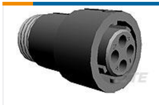
TE 产品编号1445535-3 PLUG,8-2,LG INS,STD KEY