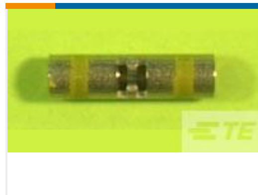
TE 产品编号680329-000 D-609-09