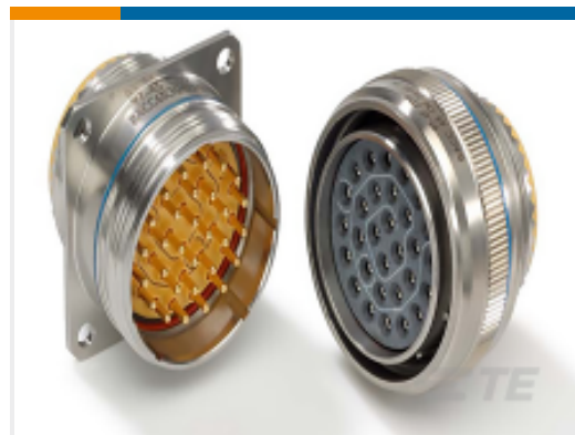
TE 产品编号ZPF000000000007454 983-0SE 08-03 P6