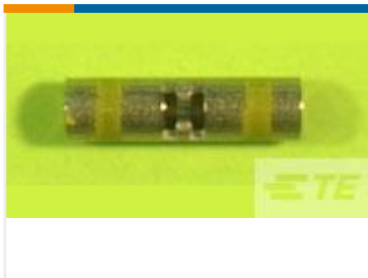
TE 产品编号680330-000 D-609-10