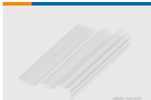
TE 产品编号NB12814001 RNF-100-CL 热缩管