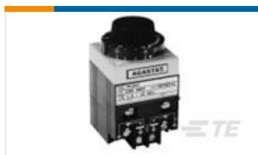
TE 产品编号1423179-2 7032PBB=RLY,STD,DBH,2P,125VDC,