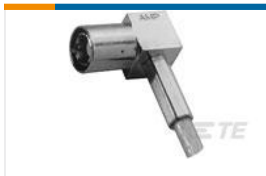
TE 产品编号5414363-4 PLUG,CABLE,RTANG,SMB, PB FREE