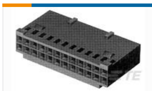
TE 产品编号87922-1 10 MODIV HSG W/STR RLF DR MRKD