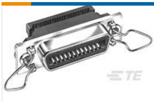
TE 产品编号554902-1 EMI RCPT ASSY,50 POSN,SHLD