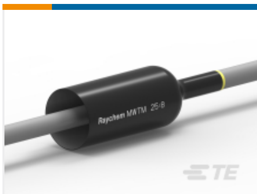
TE 产品编号 381522-000 MWTM-25/8-1000/S(S10)