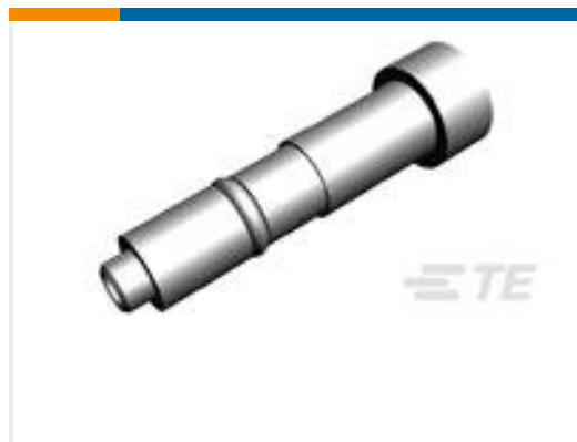
TE 产品编号 1588700-1 PRO BEAM JR, FRRL KIT, FLAT 126 SEALED