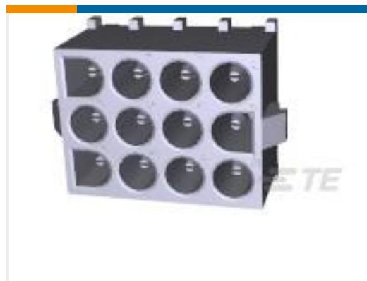
TE 产品编号350737-1 12P UMNL PIN HDR ASSY 94VO