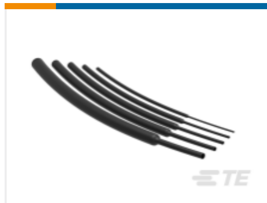
TE 产品编号NB20424001 VERSAFIT-3/32-0-SP