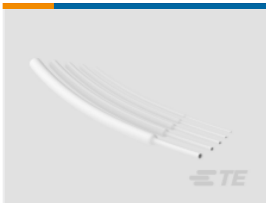
TE 产品编号NB20234001 VERSAFIT-1/8-9-SP