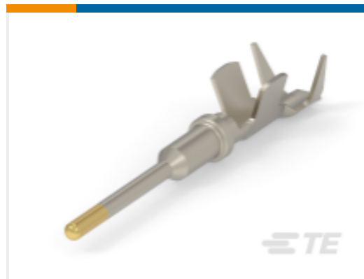
TE 产品编号1060-20-0244-PS PIN, SF, SIZE 20, 16-22, AU/SN, 100 PC