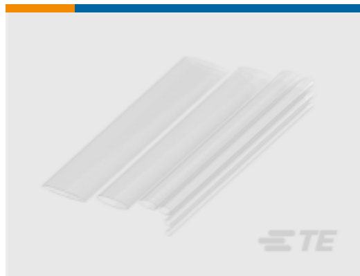
TE 产品编号NB19242001 RNF-100-CL 热缩管