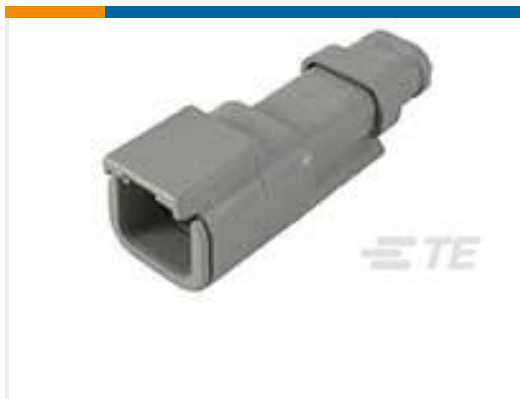
TE 产品编号DTM04-2P-E007 REC, 2P, GRY, N, XCAP