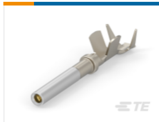
TE 产品编号1062-20-0244-PS SOC, SF, SIZE 20, 16-22, AU/SN, 100 PC