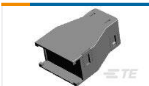
TE 产品编号1986185-1 Strain Relief,6 Posn,D5200 Dynamic. 2