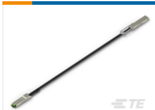
TE 产品编号2333393-7 QSFP 25GIG 30AWG 3 METER