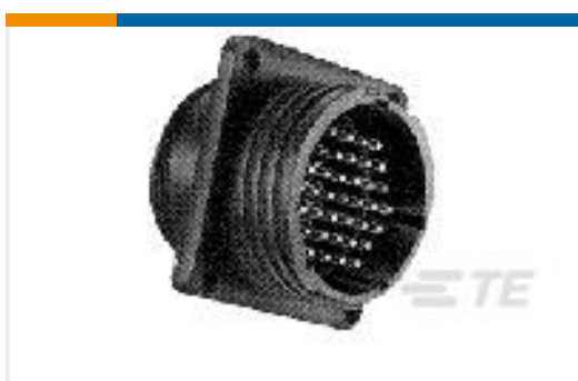
TE 产品编号206036-1 RECEPT, SZ 17-16 CPC