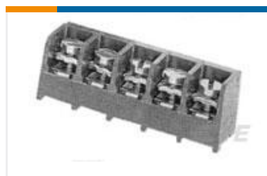
TE 产品编号1437652-5 6PCR-09-006=#6 TRIBARRIER