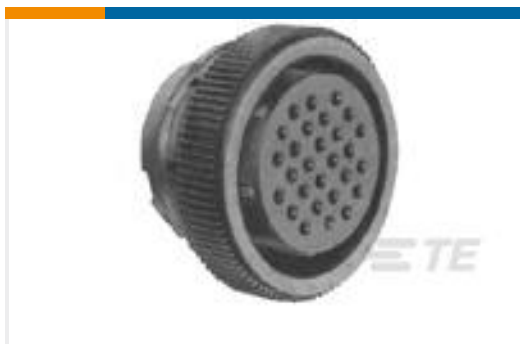
TE 产品编号205838-1 CPC PLUG ASSEMBLY SIZE 11-8