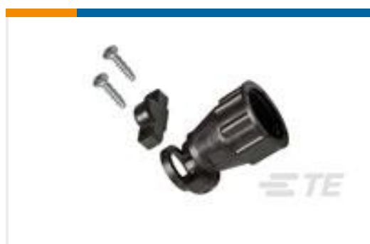
TE 产品编号1-206062-6 CABLE CLAMP KIT #11