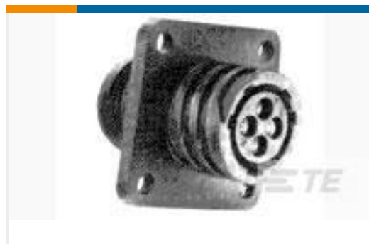
TE 产品编号206043-1 RECEPT, SZ 17-14 CPC