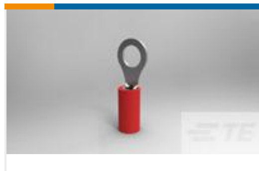
TE 产品编号8-31887-1 PIDG R 22-16 COMM 22-18 MIL 10