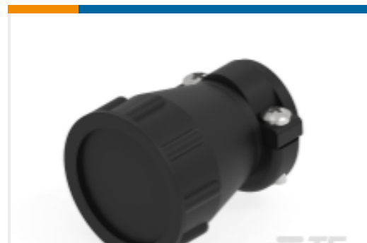
TE 产品编号1-206070-1 CABLE CLAMP KIT #17