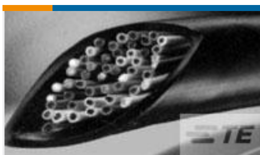
TE 产品编号 7973394002 NTRF-1-1/2-0-SP