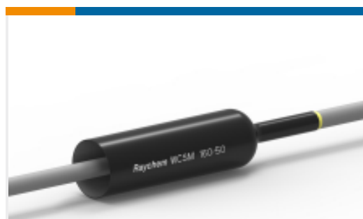
TE 产品编号CU4622-000 厚壁热缩管