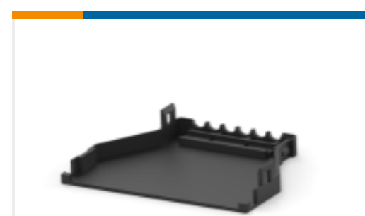
TE 产品编号1776695-1 Strain Relief, D5200, Dynamic