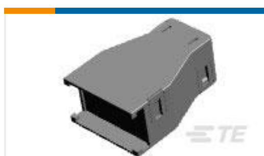
TE 产品编号1986185-1 Strain Relief,6 Posn,D5200 Dynamic. 2