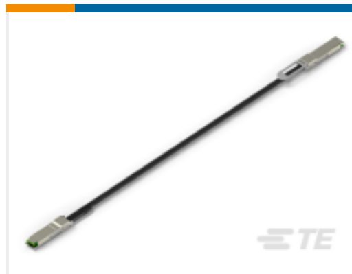
TE 产品编号2333393-7 QSFP 25GIG 30AWG 3 METER