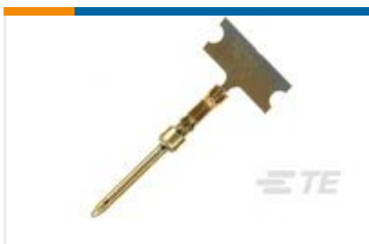
TE 产品编号5066682-6 CONT,PIN,PLATED,20DF,STRIP,#24-28