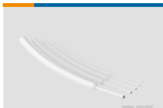
TE 产品编号NB15554001 RNF-100-WH 热缩管