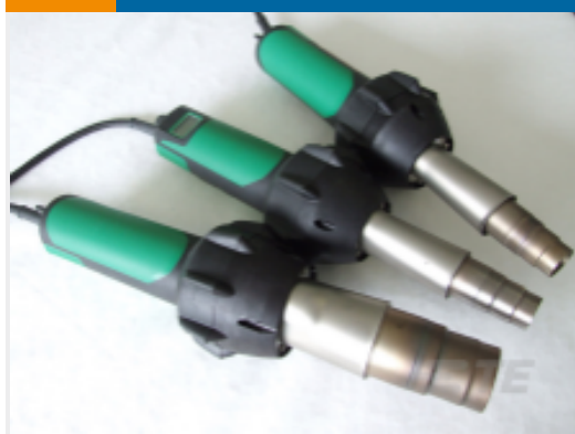
TE 产品编号 EG1114-000 CV1981-ST-230V1600W-EU