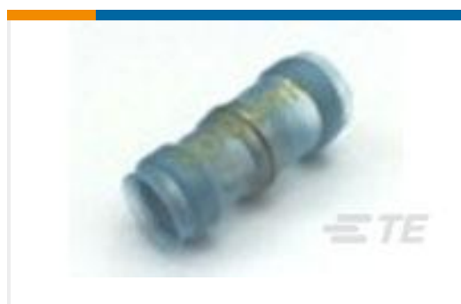
TE 产品编号621054-000 D-142-50