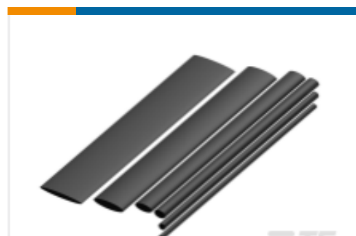
TE 产品编号NB15734001 RNF-150 热缩管