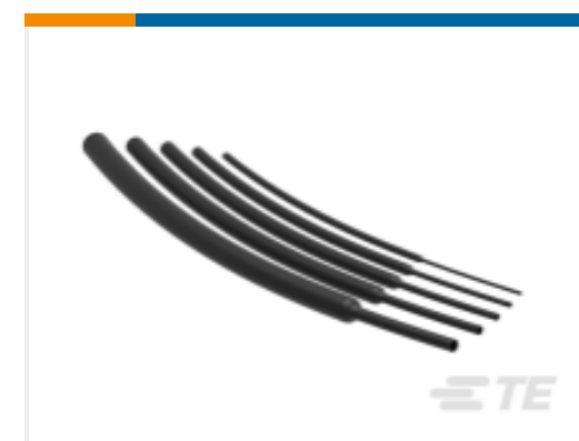
TE 产品编号 NB15492001 RNF-100-3/64-BK-STK