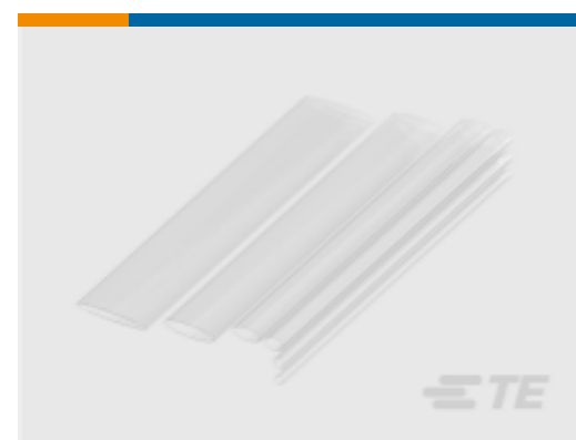
TE 产品编号 NB13612001 RNF-100-CL 热缩管