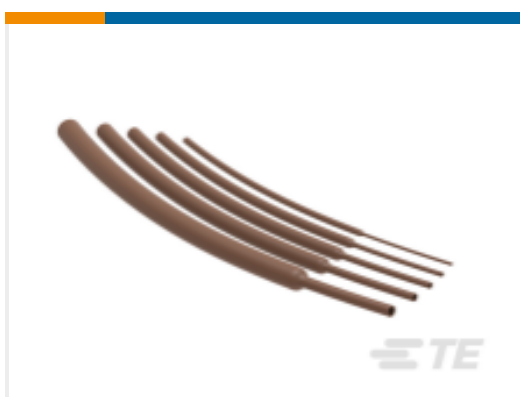
TE 产品编号 5070032034 RNF-100-X 热缩管