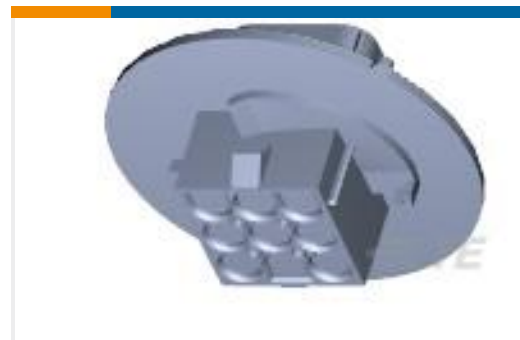
TE 产品编号794715-1 09P UMNL CAP HSG NATL,PAN MNT