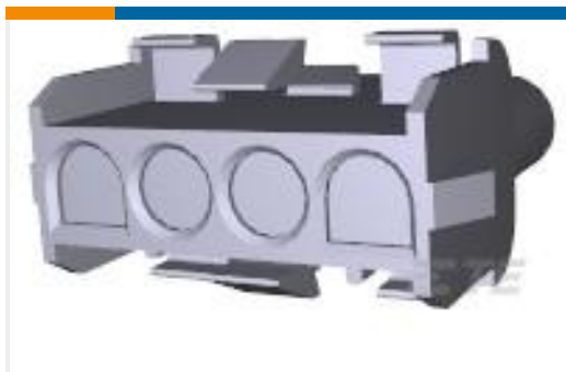
TE 产品编号1-480703-0 04P UMNL CAP HSG NATL