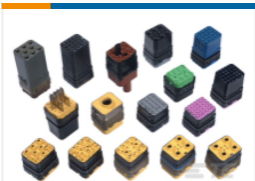
TE 产品编号ZPF00000000015203 DMC-M 04-12 PN