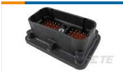
TE 产品编号DRC20-50P02 HDR, 50P, BLK, ST, AU/NI/CU, 02