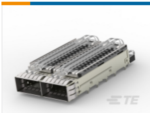
TE 产品编号2-2170808-4 QSFP28, 1X2, CAGE ASSY, SPRING, HS, LP