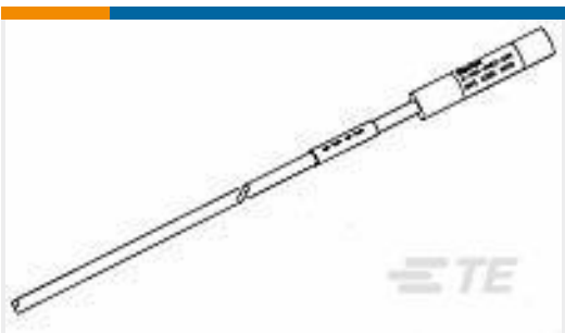
TE 产品编号CB4686-000 D-500-0463-H44-R120