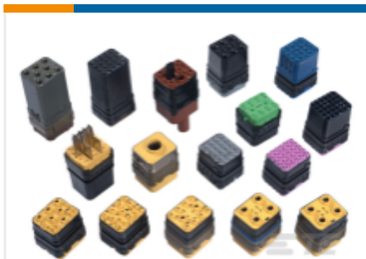
TE 产品编号ZPF00000000015209 DMC-M 04-12 SN