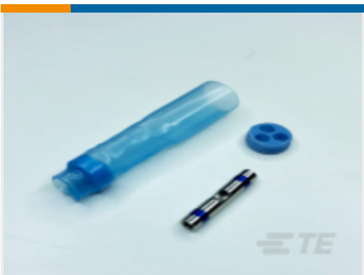
TE 产品编号CU3031-000 D-200-89