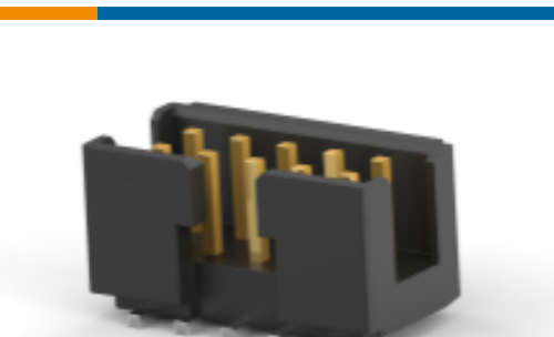
TE 产品编号1-2373376-0 10P,2MM,SHRD HDR,DRVT,SMD,0.1 AU,TB