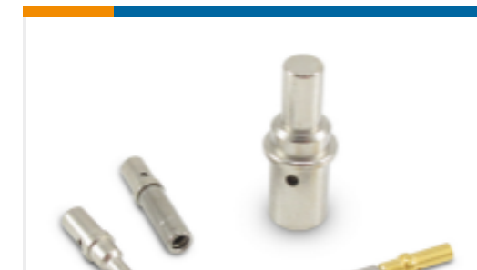
TE 产品编号0460-202-16141 DEUTSCH Solid Contacts