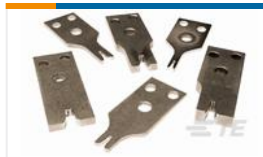
TE 产品编号 1803019-4 CRIMPER, INSULATION O