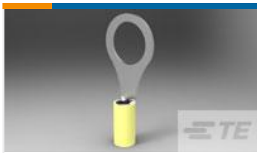
TE 产品编号 331467 N PIDG RING 12-10