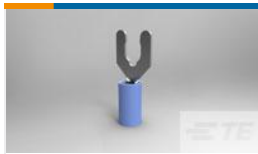
TE 产品编号 52937 TERMINAL, PIDG SPR SPD 16-14 10