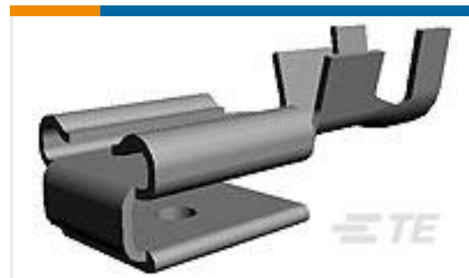
TE 产品编号 61988-2 250 FASTON REC 22-18 AWG TPBR