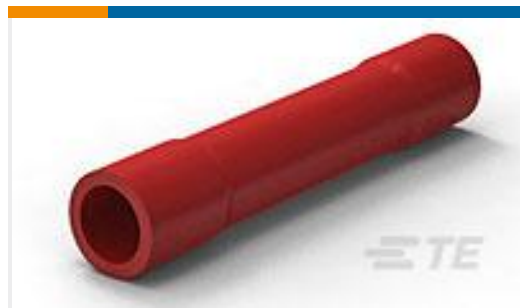
TE 产品编号 34243 PG BUTT SPLC 22-16COMM22-18MIL