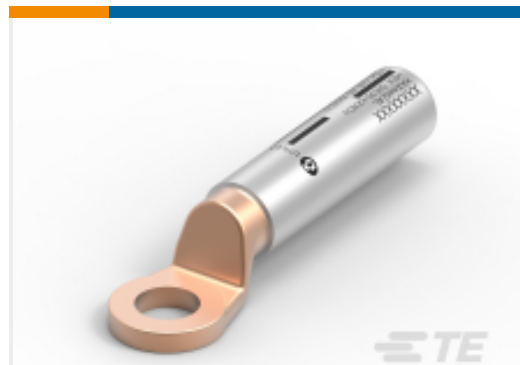
TE 产品编号CF2637-000 BG120M12/1