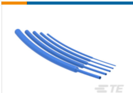
TE 产品编号NB12802001 RNF-100-1/2-BU-STK