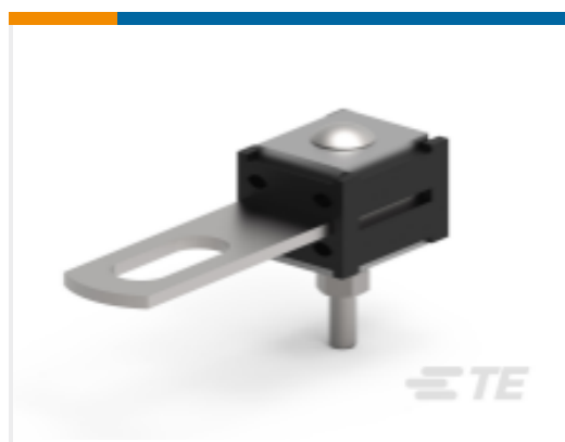
TE 产品编号E07098-000 HEL-3929-FS