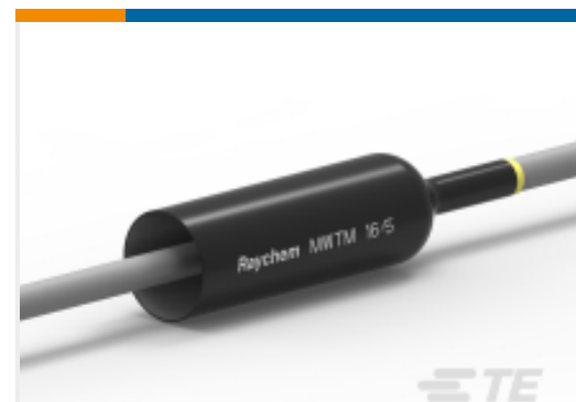
TE 产品编号412544-000 MWTM-16/5-300/S(S50)