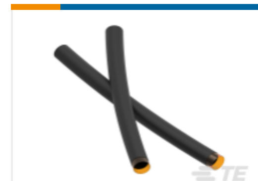
TE 产品编号NB24322001 TAT-125-3/8-0-STK