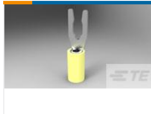
TE 产品编号52430-3 TERMINAL,PIDG SPR SPD 12-10 6