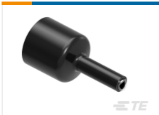
TE 产品编号NB07696001 HTAT-24/6-0-70MM