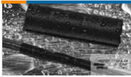
TE 产品编号063725P022 ES2000-NO.2-B9-0-STK