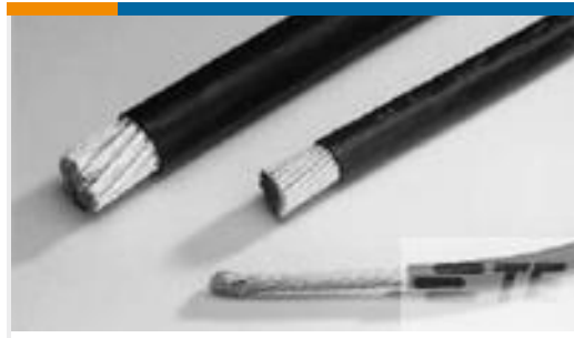
TE 产品编号9166473001 TR16-35-0