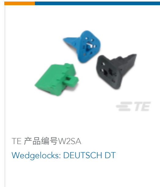
TE 产品编号W2SA Wedgelocks: DEUTSCH DT