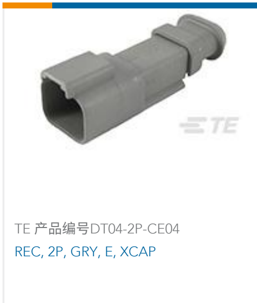
TE 产品编号DT04-2P-CE04 REC, 2P, GRY, E, XCAP