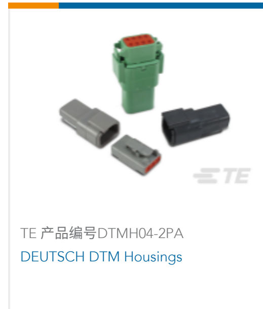
TE 产品编号DTMH04-2PA DEUTSCH DTM Housings