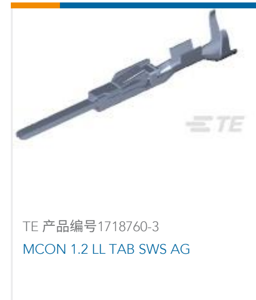
TE 产品编号1718760-3 MCON 1.2 LL TAB SWS AG