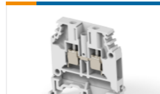
TE 产品编号1SNA115192R0400 M4/6.4