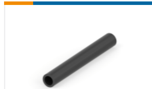
TE 产品编号NB07892001 HTAT 热缩管