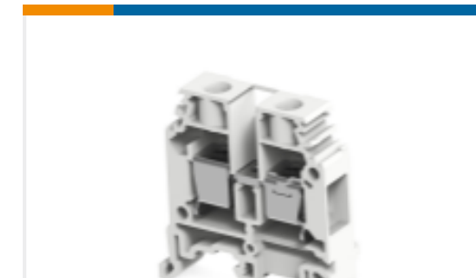
TE 产品编号1SNA115261R2000 M10/10.1