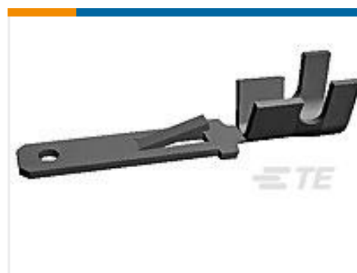
TE 产品编号280080-4 FF 250 TAB 4-6MM2 TPPB