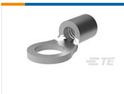
TE 产品编号33459-4 TERMINAL,SOLIS R 12-10 5/16