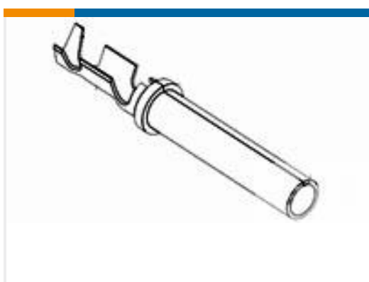
TE 产品编号1924464-1 SOC, SF, SIZE 16, 18-20 AWG, AU/SN