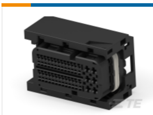
TE 产品编号2-2289748-0 58POS, MIXED,REC HSG,ASSY