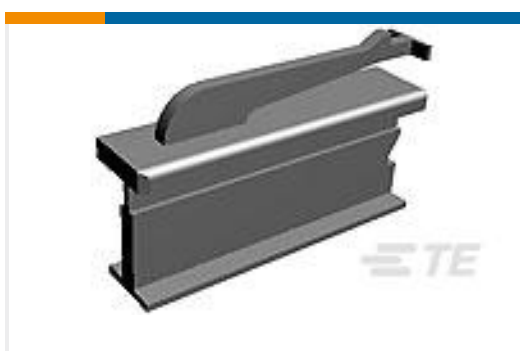
TE 产品编号1355528-2 MPQ 2.KONT-SICHNG8P