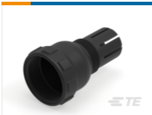
TE 产品编号M902-2163 BKSHL, 6SZ, CBL SZ .430-.570, HD10