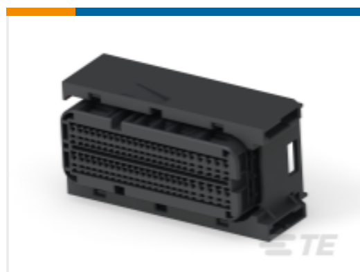
TE 产品编号8-1564284-6 96POS,MCON-1.2 CB,REC HSG,ASSY