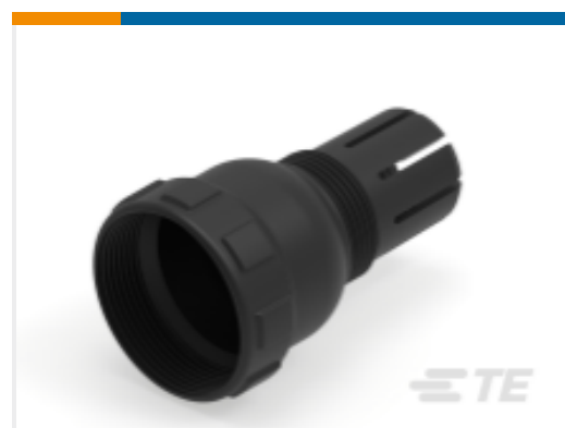
TE 产品编号M902-2343 BKSHL, 24SZ, CBL SZ .430-.570, HD30 072