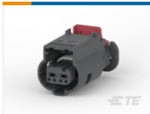
TE 产品编号5-2297790-1 2POS,HPF 1.2,REC HSG,ASSY,SLD