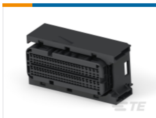
TE 产品编号8-1564284-5 96POS,MCON-1.2 CB,REC HSG,ASSY