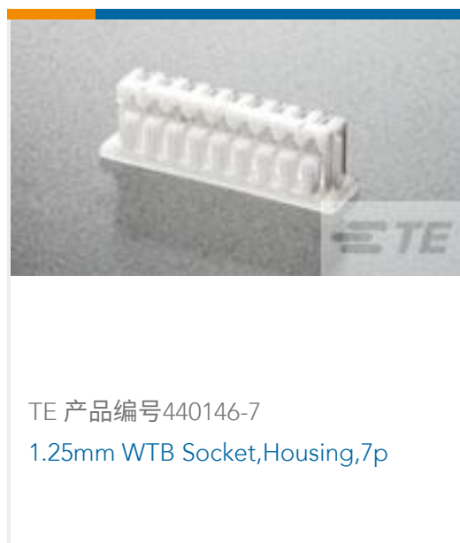
TE 产品编号440146-7 1.25mm WTB Socket,Housing,7p