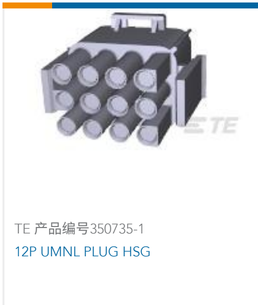
TE 产品编号350735-1 12P UMNL PLUG HSG