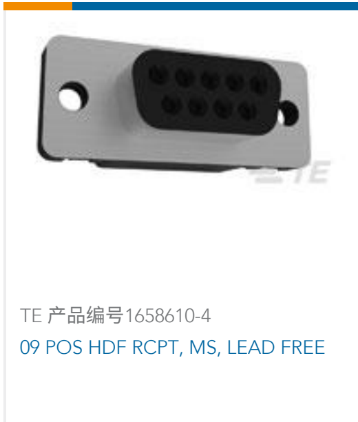
TE 产品编号1658610-4 09 POS HDF RCPT, MS, LEAD FREE