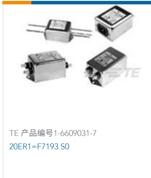
TE 产品编号1-6609031-7 20ER1=F7193 S0