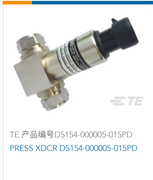
TE 产品编号D5154-000005-015PD PRESS XDCR D5154-000005-015PD