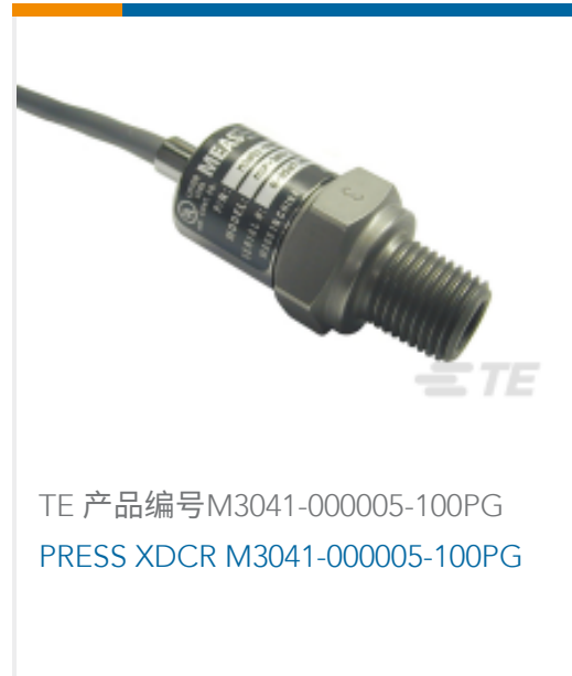
TE 产品编号M3041-000005-100PG PRESS XDCR M3041-000005-100PG