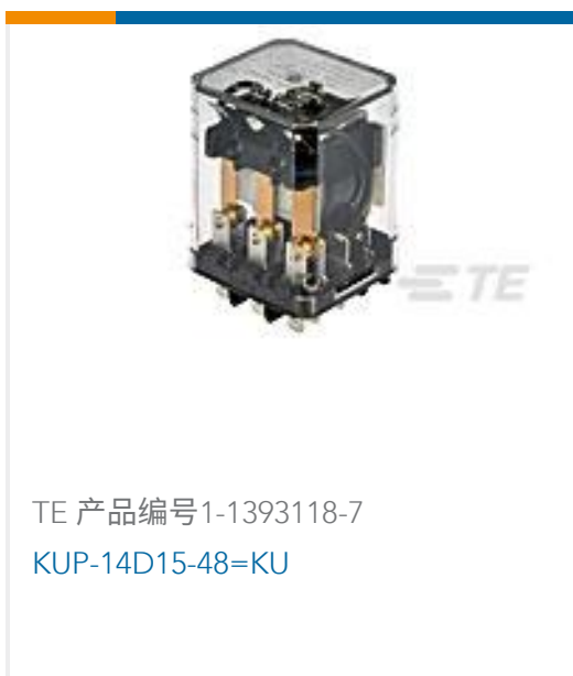
TE 产品编号1-1393118-7 KUP-14D15-48=KU