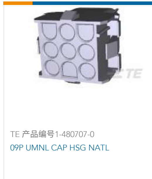
TE 产品编号1-480707-0 09P UMNL CAP HSG NATL LP