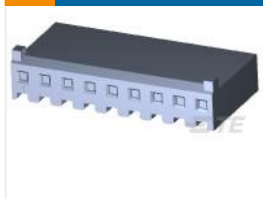
TE 产品编号770849-9 09P SL156 HSG W/LCK RMP & TABS