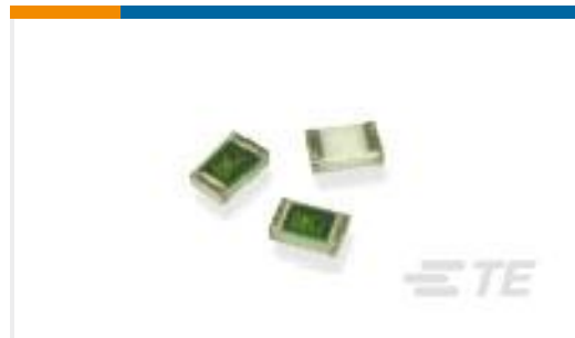
TE 产品编号2-2176087-7 RP 1J 0.166W 127R 0.1% 25PPM 1K RL