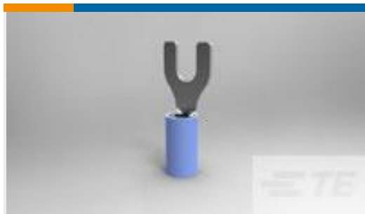
TE 产品编号32059 TERMINAL,PIDG SPD 16-14 8