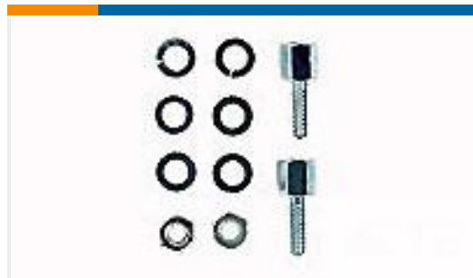
TE 产品编号5207952-1 KIT SCREWLOCK FEMALE