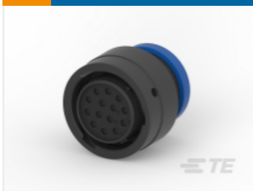
TE 产品编号HDP26-18-14SE-L017 PLG, 14P, BLK, E, RNG, 16, S