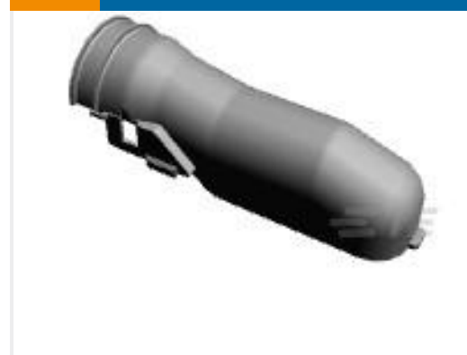
TE 产品编号1418994-1 AMP MCP 2.8 HSG.WITH SEC.10POS