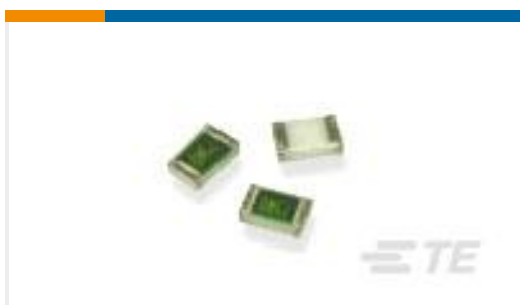
TE 产品编号9-1625867-4 RP 1J 0.166W 59R 0.1% 25PPM 1K RL