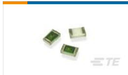
TE 产品编号8-2176087-4 RP 1J 0.166W 511R 0.1% 25PPM 1K RL