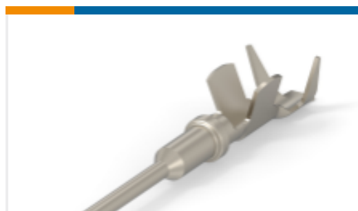
TE 产品编号1060-20-0122-PS PIN, SF, SIZE 20, 16-22, NI/NI, 100 PC