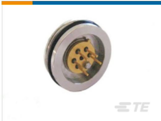
TE 产品编号82-050A-U PRESS SENSOR;NISO,82-050A-U