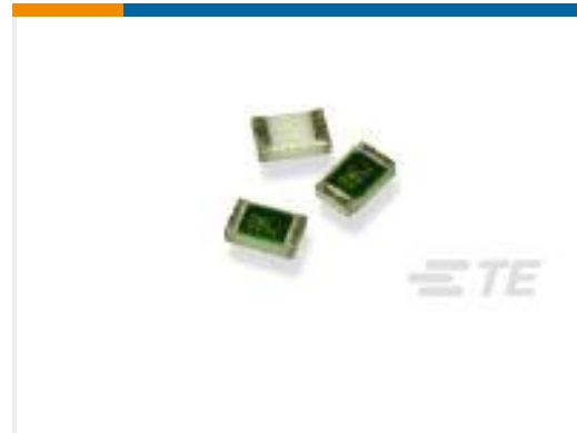
TE 产品编号2-1614884-0 CPF 0805 13R 0.1% 25PPM 1K RL