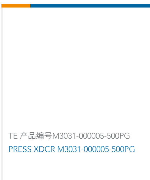
TE 产品编号M3031-000005-500PG PRESS XDCR M3031-000005-500PG