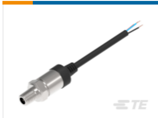
TE 产品编号20014203-11 PRESS XDCR M325M-000005-01KPG